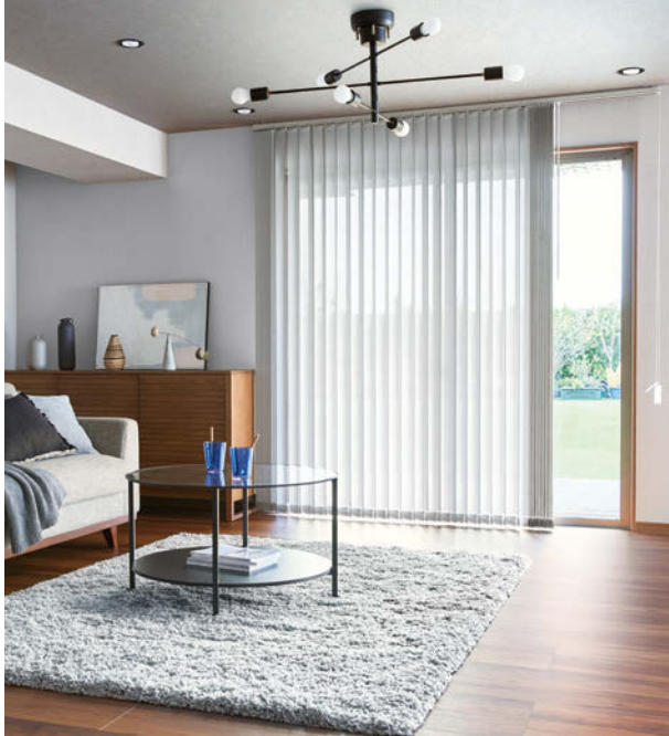
デュアルツイン コード&ボタンタイプ クラリッサ TF-8108(シルバーグレー) ツインレース：TF-8303(グレー) ボトムコードなし仕様 部品カラー：グレージュ(オプション)