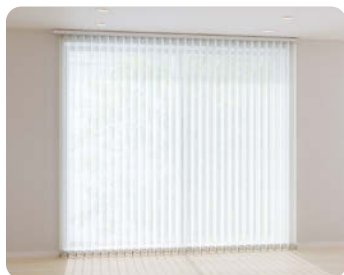
全レース：レースルーバーで外光を取り込む