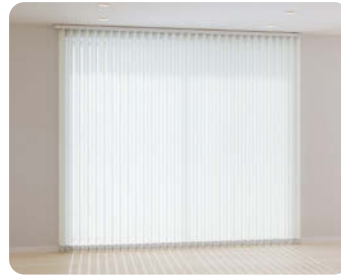
調光：レースルーバーで外光を取り込む