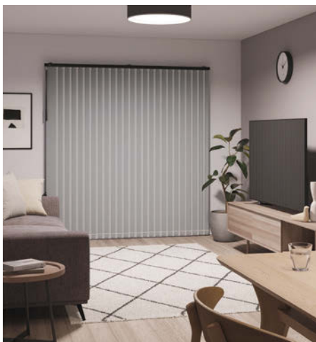
デュアルツイン コード&ボタンタイプ コルト TF-8033(マテリアルグレー) ツインレース：TF-8303(グレー) 部品カラー：ブラック(オプション)