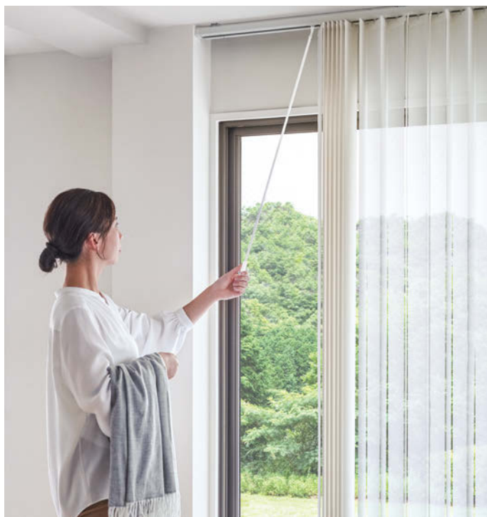
デュアルツイン コード&バトンタイプ ルノブレン TF-8005(ミルクィーホワイト) ツインレース：TF-8301(ホワイト) 部品カラー：ホワイト